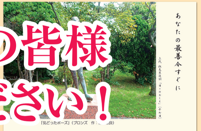
【気どったポーズ】(ブロンズ 作: 上代淑先生)