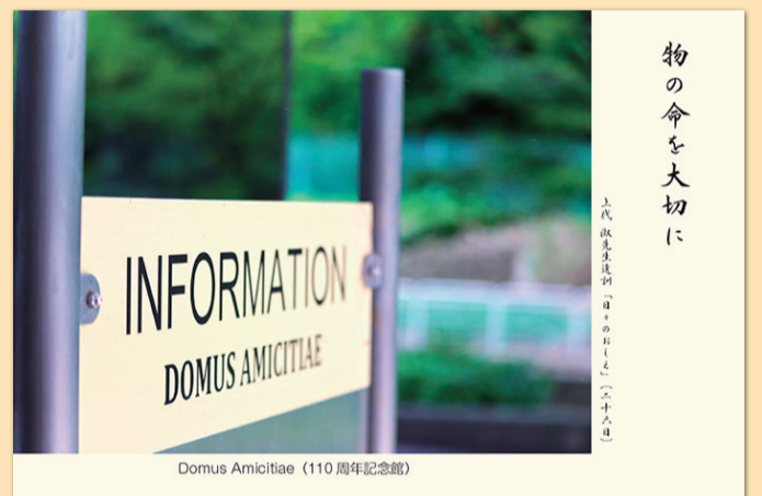
Domus Amicitiae (110周年記念館)