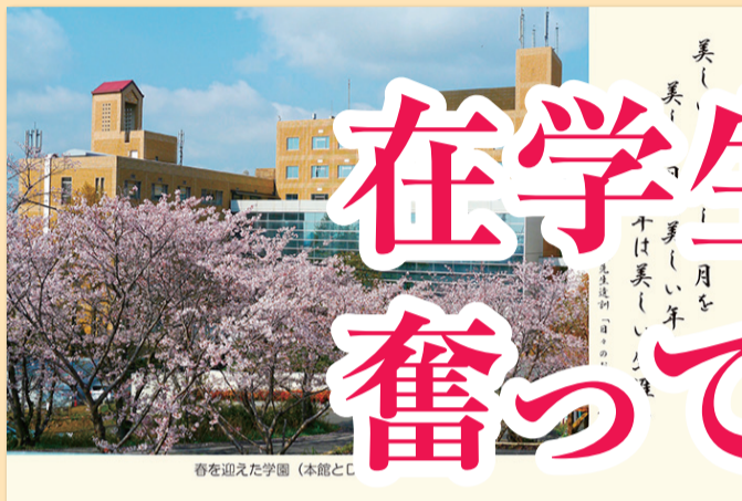
春を迎えた学園（本館とC