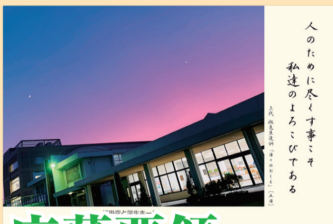
山陽スピリット推進室