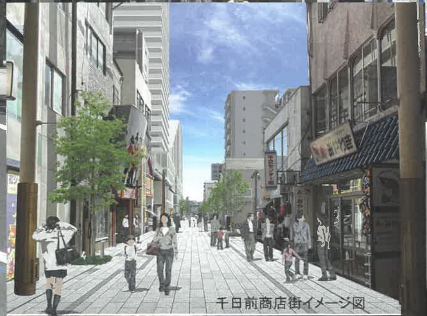
千日前商店街イメージ図